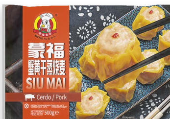
Siu Mai de cerdo new Ref. 6083 - 10 x 500g

Carne y verduras · Carn i verdures · Meat and vegetables · Viande et légumes