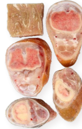
Piernas de vaca