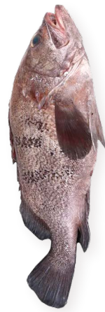
Grouper (Mero) Ref. 5750 - 300-400g - 1x10Kg