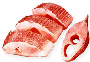
Tilapia roja rodajas Ref. 5742 - 1 x 4Kg