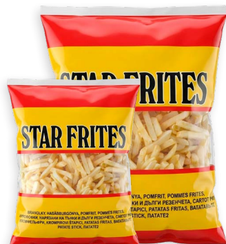
Patatas Fritas Congeladas Ref. 5638 - 12 x 1kg Ref. 5637 - 5 x 2,5kg