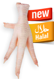
Garras de pollo Ref. 5653 - 1 x 10kg