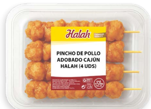
Pinchos de pollo adobados Cajún Halah new Ref. 5794 - 6 x 2,4kg (4 uds)