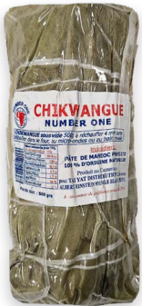
Chikwangue/ Yuca fermentada Ref. 4097 - 40 x 500g