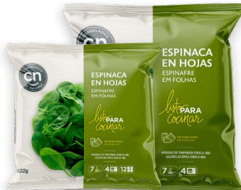
Espinaca en Hojas CN Ref. 5592 - 15 x 400g Ref. 5591 - 10 x 1kg