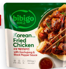
Pollo frito estilo coreano Gochujang y salsa de Pimienta negra Bibigo Ref. 5722 - 10 x 350g

Gochujang i salsa de pebre negre · Gochujang & Black Pepper Sauce · Gochujang et sauce au poivre noir