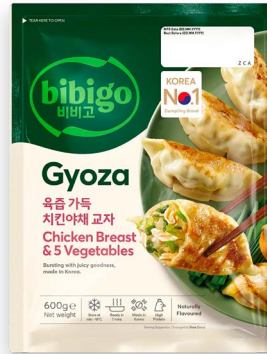
Gyozas de pechuga de pollo y 5 verduras Bibigo new Ref. 6099 - 12 x 600g Pollastre i 5 verdures · Chicken and 5 vegetables · Poulet et 5 légumes

Vedella amb sabor barbacoa · Barbecue flavored beef · Boeuf au goût barbecue