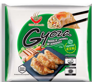
Gyozas de verduras Authentic new Ref. 6075 - 12 x 600g

Langostino · Llangosti · King prawn · Gambas