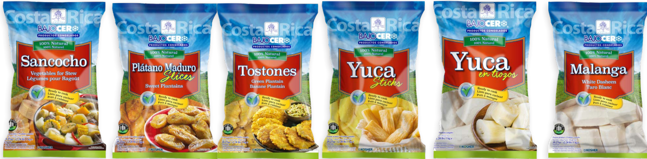
Sancocho Bajo Cero Ref. 2691 - 12 x 1kg

Verdura congelada · Frozen vegetables · Légumes surgelés