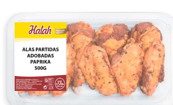
Alas partidas adobadas Paprika Halah new Ref. 5795 - 6 x 3kg (500g)