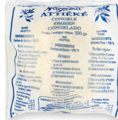
Attiéké - Yuca fermentada Ref. 0433 - 20 x 500g