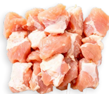
Carne de pollo para brochetas Paprika Ref. 5814 - 8 x 500g