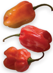
Pimientos antillanos Ref. 0459 - 3 x 1Kg