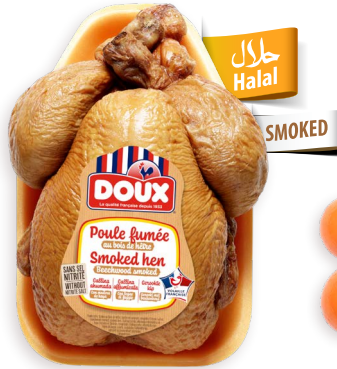
Gallina ahumada y congelada Ref. 0404 - 8u