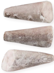
Colas de Merluza Ref. 5163 - 200-350g 1 x 8kg