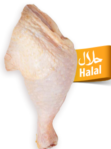
Muslos de pollo Ref. 0410 - 1 x 5kg Ref. 4878 - 1 x 10kg