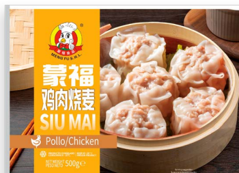
Siu Mai de pollo new Ref. 6084 - 10 x 500g