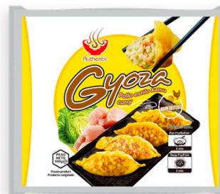
Gyozas de pollo estilo Katsu Curry Authentic new Ref. 6079 - 12 x 600g

Pollo estilo katsu curry · Pollastre a l'estil katsu curry · Katsu curry style chicken · Poulet style katsu curry