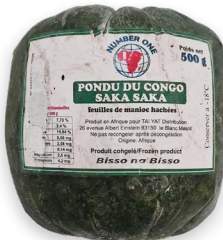
Saka Saka/ Pondu/ Hojas de yuca Ref. 3928 - 20 x 500g