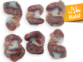
Mollejas de pavo Ref. 0408 - 9 x 1kg