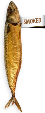
Thompson ahumado Ref. 0427 - 1 x 3Kg