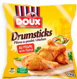
Muslos de pollo con sabor a pimienta Doux new Ref. 5737 - 10 x 1kg