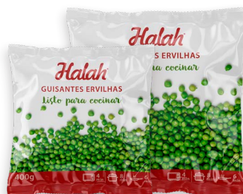
Guisante Halah Ref. 5590 - 25 x 400g Ref. 5589 - 10 x 1kg