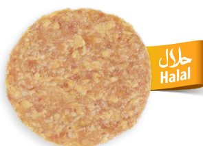
Burger Meat de pollo Halah Ref. 5790 - 1 x 2,88kg - 48 uds (60g)