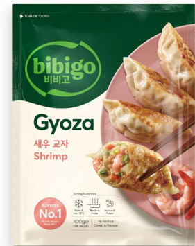
Gyoza de Gamba Bibigo Ref. 5377 - 16 x 400g

Kimchi i pollastre · Kimchi and chicken · Kimchi et poulet