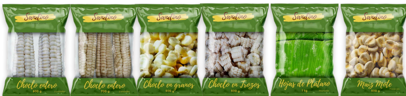
Choclo entero 2u Sandino Ref. 4042 - 12 x 600g (2u)