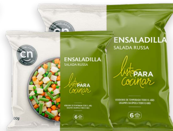
Ensaladilla CN Ref. 5594 - 15 x 400g Ref. 5593 - 10 x 1kg