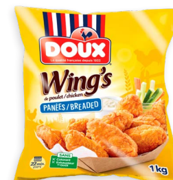
Alitas de pollo rebozadas Doux new Ref. 5736 - 12 x 1kg