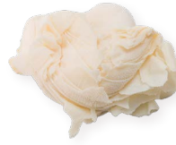
Librillo de vacuno