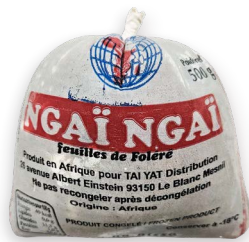
Kouthia/ Hojas de Bissap/ Ngai Ngai Ref. 0456 - 20 x 500g