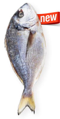
Dorada Ref. 5748 - 200-300g - 1x5Kg