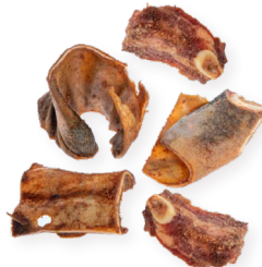
Orejas de vaca