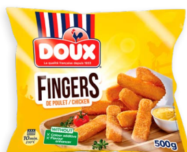
Fingers de pollo Doux new Ref. 5730 - 10 x 500g