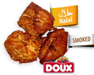
Rabadillas de pavo ahumadas Ref. 5225 - 10 x 1kg

0402. Gallina congelada · Gallina congelada · Frozen hen · Poule surgelé 2839. Cuartos / Muslos de gallina congelada · Quarts / Cuisses de gallina congelada · Frozen hen leg quarters · Quartiers / Cuisses de poule 0404. Gallina ahumada y congelada · Gallina fumada i congelada · Frozen smoked hen · Poule fumée et surgelée 5654. Yemas / Ovarios de gallina · Rovells / Ovaris de gallina · Chicken egg yolks / Chicken ovaries · Jaunes d'œuf / Oviaires de poule 0407. Muslos de pavo · Cuixes de gall dindi · Turkey Thighs · Cuisses de dindon 5053. Puntas de alas de pavo · Pundes d'ales de gall dindi · Dindi turkey wing points · Pointes d'ales de dindes 0408. Mollejas de pavo · Pedrers de gall dindi · Sweetbreed of turkey · Grésiers de dindon 0406. Alas de pavo · Ales de gall dindi · Turkey wings · Ailes de dindon 3917. Alas de pavo ahumadas y congeladas · Ales de gall dindi fumades i congelades · Frozen Smoked Turkey wings · Ailes de dindon fumées et surgelées 0409. Rabadillas de pavo · Rabades de gall dindi · Turkey parson's nose · Croupions de dindon 5225. Rabadillas de pavo ahumadas · Rabadilla de gall dindi fumat · Smoked turkey rumps · Croupion de dinde fumé