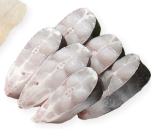
Panga rodajas Ref. 5236 - 4 x 1Kg