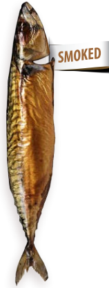
Mackerel / Caballa ahumado Ref. 0423 - 1 x 5Kg