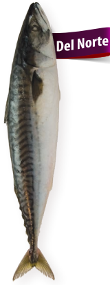
Mackerel / Caballa Ref. 0422 - 300-500g 1x20Kg