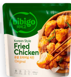
Pollo frito estilo coreano Original Bibigo Ref. 5721 - 10 x 350g

Soja i mel · Soy and honey · Soja et miel