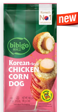
Corndog de pollo Bibigo Ref. 5728 - 12 x 160g

Corndog estil coreà · Korean-style corndog · Corndog style coréen