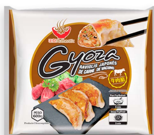
Gyozas de ternera Authentic new Ref. 6077 - 12 x 600g