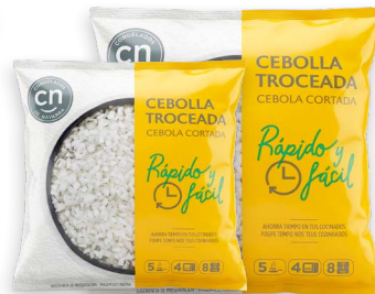
Cebolla picada Ref. 6104 - 15 x 400g Ref. 6103 - 10 x 1kg