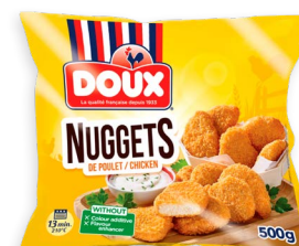
Nuggets de pollo Doux new Ref. 5729 - 10 x 500g