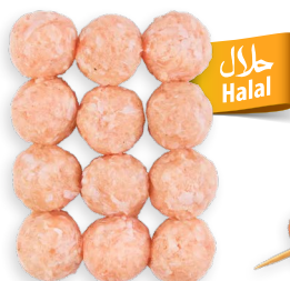
Albóndigas de pollo Ref. 5811 - 4 x 1kg