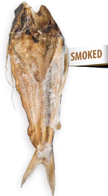
Catfish ahumado Ref. 0417 - 1 x 5Kg