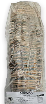
Miondo / Yuca fermentada Ref. 4096 - 10 x 1kg