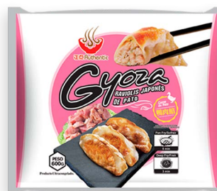
Gyozas de pato Authentic new Ref. 6076 - 12 x 600g

Verduras · Verdures · Vegetables · Légumes