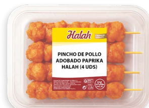
Pinchos de pollo adobados Paprika Halah new Ref. 5796 - 6 x 2,4kg (4 uds)