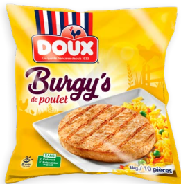
Burgy's de pollo Doux new Ref. 5733 - 12 x 1kg (10 uds)