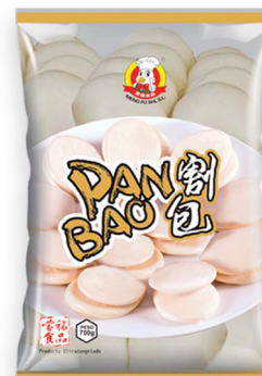
Pan Bao Blanco Ref. 6080 - 8 x 700g (15 unidades)