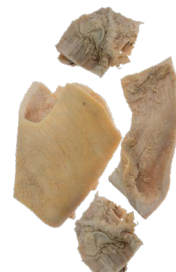
Tripas de vaca "SHAKI"