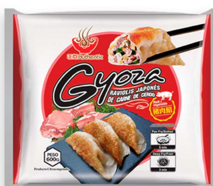
Gyozas de cerdo Authentic new Ref. 6078 - 12 x 600g