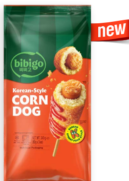
Corndog estilo coreano Bibigo Ref. 5695 - 12 x 240g

Pollastre cruixent estil coreà amb soja i mel · Crispy Korean-style chicken with soy and honey · Poulet croustillant style coréen avec soja et miel