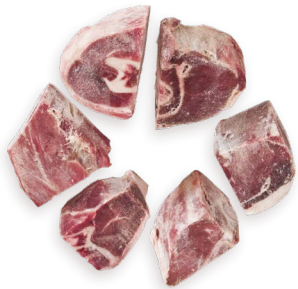
Trozos de cabra