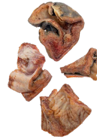
Kpomo/ Piel Carnosa de vaca