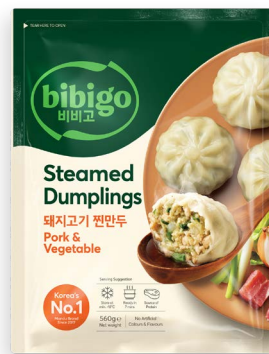
Dumplings al vapor de cerdo y verduras Bibigo new Ref. 5719 - 15 x 560g

Pollastre i verdures · Chicken and vegetables · Poulet et légumes