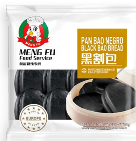
Pan Bao Negro Ref. 6081 - 8 x 700g (15 unidades)