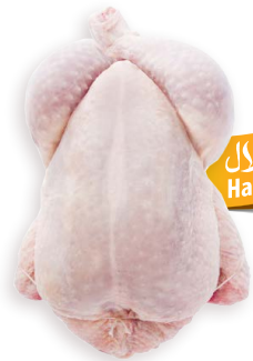
Gallina congelada Ref. 0402 - 1 x 10kg