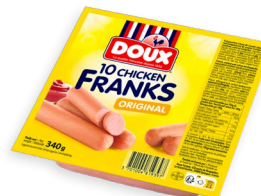
Frank's de pollo new Ref. 5738 - 24 x 340g (10 uds)