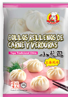
Xiao Long Bao - Bollos rellenos de carne y verduras new Ref. 6082 - 8 x 420g

Pollo estilo katsu curry · Pollastre a l'estil katsu curry · Katsu curry style chicken · Poulet style katsu curry