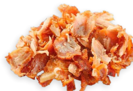
Carne de pollo para kebab Ref. 5815 - 4 x 1kg