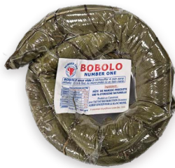
Bibolo/ Bobolo Yuca fermentada Ref. 4095 - 15 x 500g