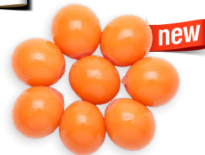
Yemas/ Ovarios de gallina Ref. 5654 - 9 x 800g