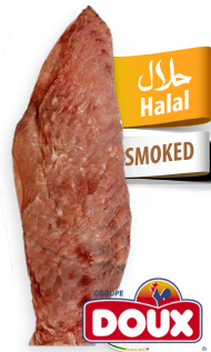
Alas de pavo ahumadas Ref. 3917 - 10 x 1kg