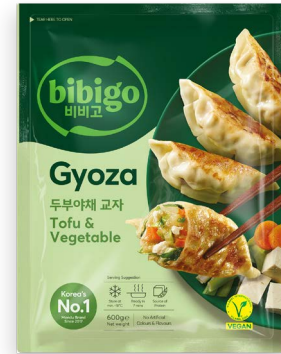
Gyoza de tofu y verduras Bibigo Ref. 5378 - 12 x 600g Tofu i verdures · Tofu and vegetables · Tofu et légumes