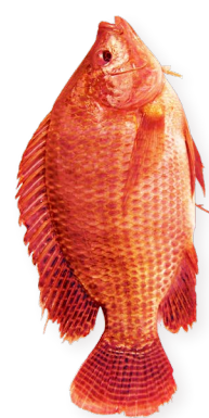
Tilapia roja Ref. 0431 - 500-700g 1 x 4Kg