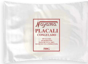
Placali - Yuca fermentada precocida Ref. 1830 - 20 x 500g