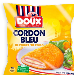
Cordon bleu de pollo Doux new Ref. 5732 - 10 x 1kg (10 uds)