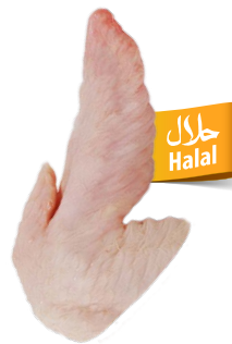
Puntas de alas de pavo Ref. 5053 - 1 x 10kg