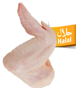
Alas de pollo Ref. 2838 - 1 x 2kg