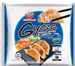
Gyozas de langostino Authentic new Ref. 6074 - 12 x 600g

Pollo y verduras · Pollastre i verdures · Chicken and vegetables · Poulet et légumes