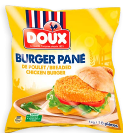
Burger Meat de pollo rebozada Doux new Ref. 5775 - 12 x 1kg (10 uds)