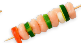
Pinchos de pollo con verduras Ref. 5813 - 1 x 3,5kg - 35 uds (100g)