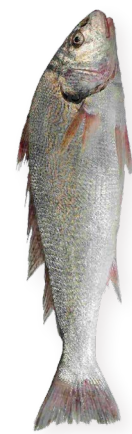
Courbine Senegal Ref. 5789 - 1 x 18Kg