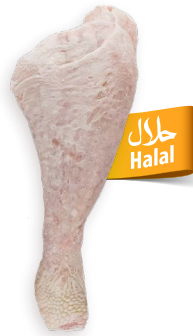
Muslos de pavo Ref. 0407 - 1 x 5kg