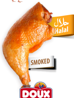
Cuartos traseros ahumados de pollo Ref. 5371 - 10 x 1kg