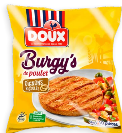
Burgy's de pollo con cebolla Doux new Ref. 5734 - 12 x 1kg (10 uds)