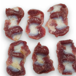
Mollejas de pollo Ref. 5478 - 9 x 1kg