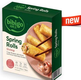
Rollitos de primavera de Gamba Bibigo Ref. 5726 - 12 x 250g