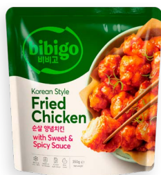
Pollo frito estilo coreano con salsa dulce y picante Bibigo Ref. 5381 - 10 x 350g

Salsa dolça i picant · Sweet and spicy sauce · Sauce sucrée et épicée