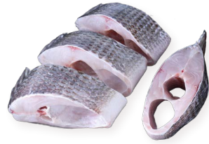
Tilapia negra rodajas Ref. 5741 - 1 x 4Kg