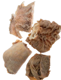
Estómago de vaca "ABODI"