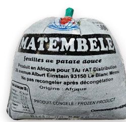
Matembele Ref. 2683 - 20 x 500g