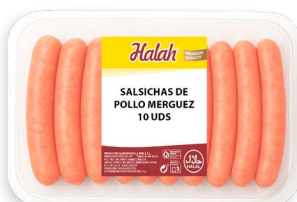
Salsichas de pollo Merguez Halah new Ref. 5792 - 6 x 1,8kg (10 uds)