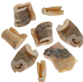
Piel de vaca blanca