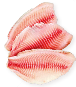
Tilapia negra fileteada Ref. 5353 - 500g 1 x 10Kg