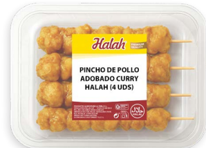
Pinchos de pollo adobados Curry Halah new Ref. 5793 - 6 x 2,4kg (4 uds)