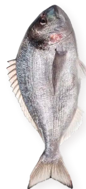
Besugo entero Ref. 5749 - 200-400g - 1x10Kg