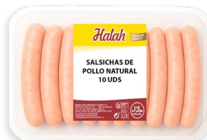
Salsichas de pollo natural Halah new Ref. 5791 - 6 x 1,8kg (10 uds)