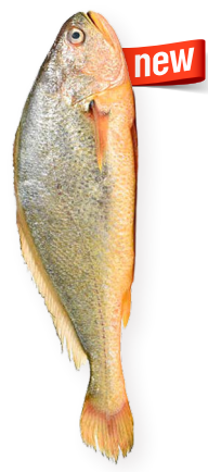
Yellow Croaker Ref. 5747 - 400-800g - 2x2,5Kg