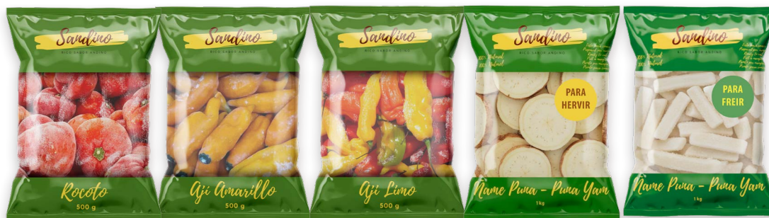
Rocoto Sandino Ref. 1162 - 12 x 500g