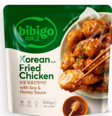
Pollo frito estilo coreano con soja y miel Bibigo Ref. 5720 - 10 x 350g

Salsa dolça i picant · Sweet and spicy sauce · Sauce sucrée et épicée