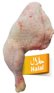
Cuartos / Muslos de gallina Ref. 2839 - 1 x 10kg