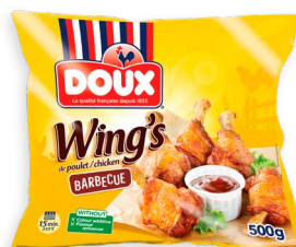
Jamoncitos de pollo sabor BBQ Doux new Ref. 5735 - 10 x 500g