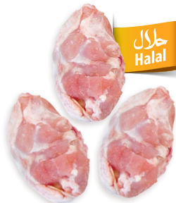
Rabadillas de pavo Ref. 0409 - 1 x 10kg