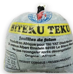
Bitekuteku Ref. 5422 - 20 x 500g