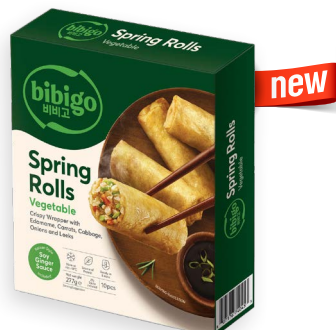
Rollitos de primavera de vegetales Bibigo Ref. 5725 - 12 x 277g