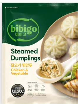
Dumplings al vapor de pollo y verduras Bibigo Ref. 5382 - 15 x 560g

Pollastre i verdures · Chicken and vegetables · Poulet et légumes