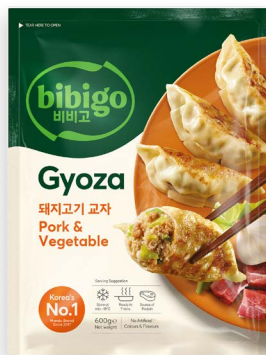
Gyoza de cerdo y verduras Bibigo Ref. 5380 - 12 x 600g

Porc i verdures · Pork and vegetables · Porc et légumes