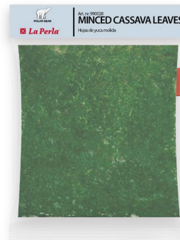
Saka Saka/ Hojas de Yuca Molida Polar Bear Ref. 5745 - 20 x 500g