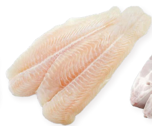
Panga fileteada Ref. 5744 - 4 x 1Kg