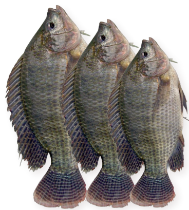
Tilapia Ref. 0428 - Grande +800g 1 x 4Kg Ref. 0430 - Mediana 500-800g 1 x 4Kg Ref. 0429 - Pequeña 300-500g 1 x 4Kg

Peix congelat · Frozen fish · Poisson surgelé