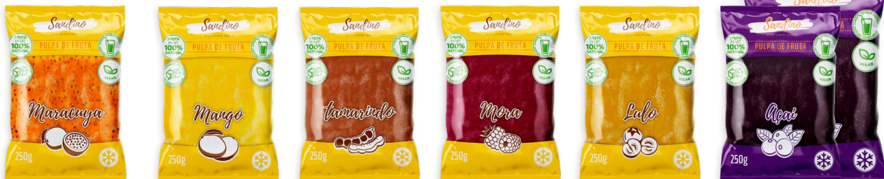
Pulpa de Maracuyá con semillas Ref. 4437 - 12 x 250g