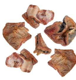
Piel de vaca marrón