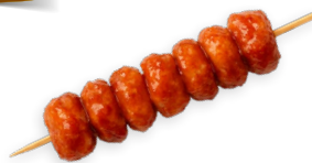
Pinchos de pollo Teriyaki Ref. 5812 - 1 x 4kg - 100 uds (40g)