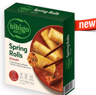
Rollitos de primavera de Kimchi Bibigo Ref. 5727 - 12 x 250g