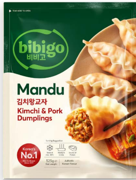
Mandu originales de Kimchi y cerdo Bibigo Ref. 5376 - 15 x 525g

Kimchi i porc · Kimchi and pork · Kimchi et porc