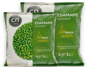
Edamame Ref. 6105 - 15 x 400g Ref. 6106 - 10 x 1kg