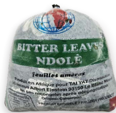
Ndole / Hojas amargas (Bitter) Ref. 4098 - 20 x 500g