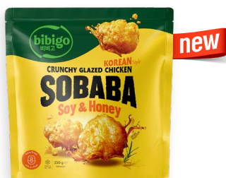
Pollo Crujiente estilo coreano con soja y miel Bibigo Ref. 5724 - 10 x 350g

Pollastre cruixent estil coreà amb soja i mel · Crispy Korean-style chicken with soy and honey · Poulet croustillant style coréen avec soja et miel