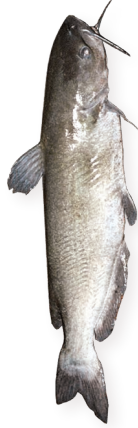
Catfish Ref. 0418 - 500-800g 1 x 3Kg