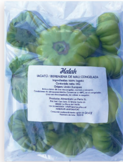
Igalatú Congelado - Berenjenas Ref. 0434 - 6 x 1Kg

Verdura congelada · Frozen vegetables · Légumes surgelés