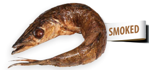
Barracuda ring ahumado Ref. 2677 - 1 x 5Kg