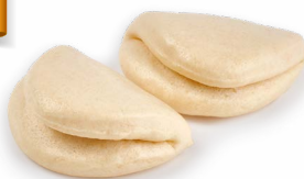
Pan Gua Bao Ref. 5746 - 10 x (10 x 50g)