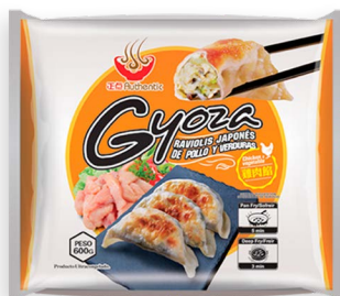
Gyozas de pollo y verdura Authentic new Ref. 6073 - 12 x 600g

Aliments orientals · Oriental food · Aliments orientaux