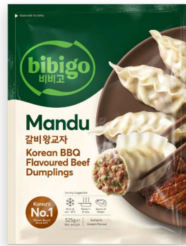
Mandu originales ternera sabor barbacoa coreana Bibigo Ref. 5383 - 15 x 525g

Kimchi i porc · Kimchi and pork · Kimchi et porc