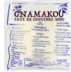
Gnamakou - Pasta de jengibre Ref. 2149 - 20 x 500g