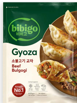
Gyoza de ternera Bulgogi Bibigo Ref. 5374 - 12 x 600g

Porc i verdures · Pork and vegetables · Porc et légumes