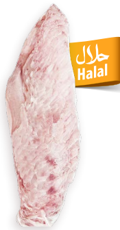
Alas de pavo Ref. 0406 - 1 x 5kg