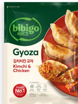
Gyoza de kimchi y pollo Bibigo Ref. 5375 - 12 x 600g

Bulgogi de vedella · Beef bulgogi · Bulgogi de boeuf