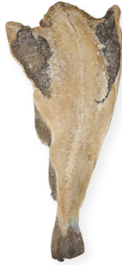
Bacalao salado - Cod Ref. 0446 - 1 x 4Kg